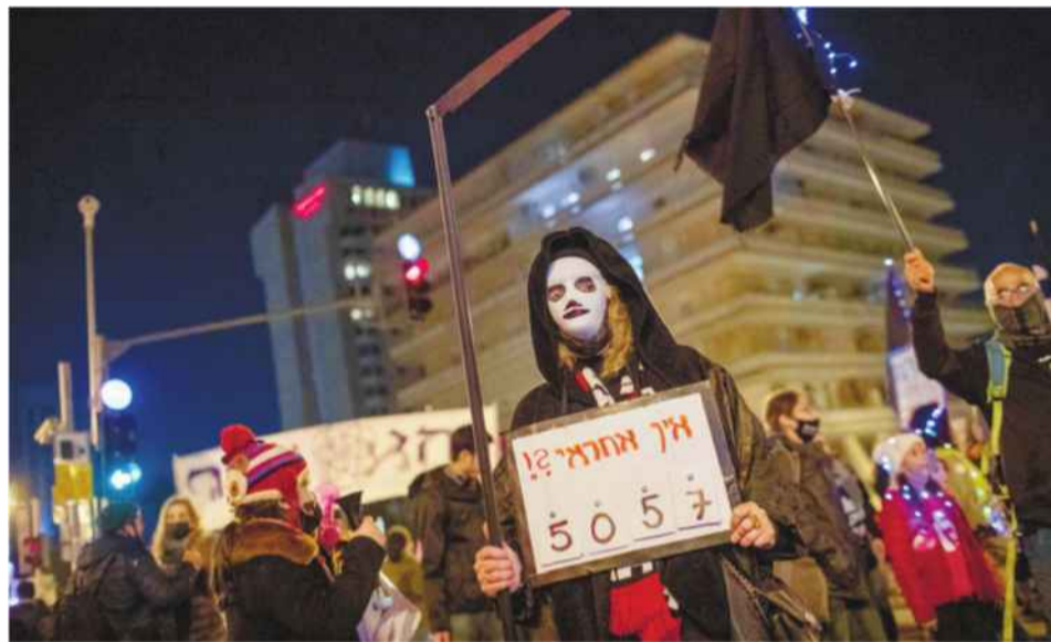
הפגנה נגד התנהלות הממשלה במשבר הקורונה, בפברואר

המערכת הפוליטית גרמה לנו נזק כבד: הצלחנו גם לעשות שלושה סגרים, יותר כמעט מכל מדינה, וגם להיכשל בניצול הסגרים להקטנת התפשטות התחלואה